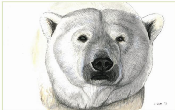
Gezeichnet von Expeditionsleiter Jamie Watts.